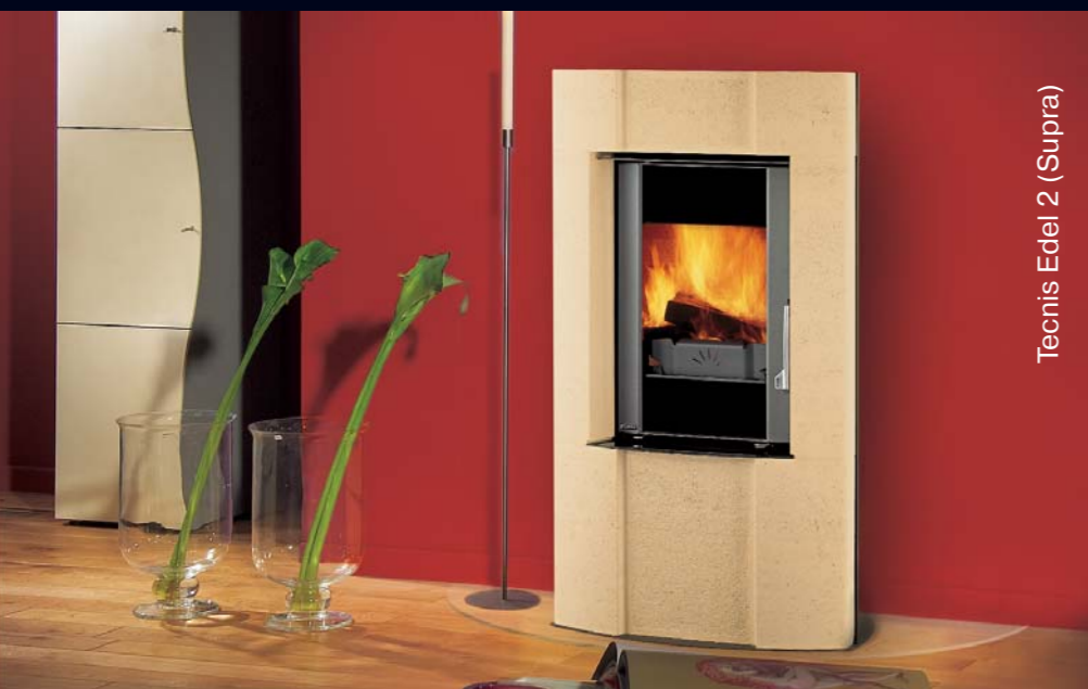
Tecnis Edel 2 (Supra)

Droff. За внимание посетителей салона конкурируют современная встроенная модель Drakkar , декорированная рамкой из нержавеющей стали, уютный и лиричный камин Bergerie , а также шикарный открытый очаг Baronnie , напоминающий лучшие образцы эпохи Возрождения. Поклонников лаконичного модерна в новом салоне ждёт единственная в своём роде модель Univers , которая демонстрирует неограниченные возможности дизайнеров в области изготовления уникальных моделей на заказ.