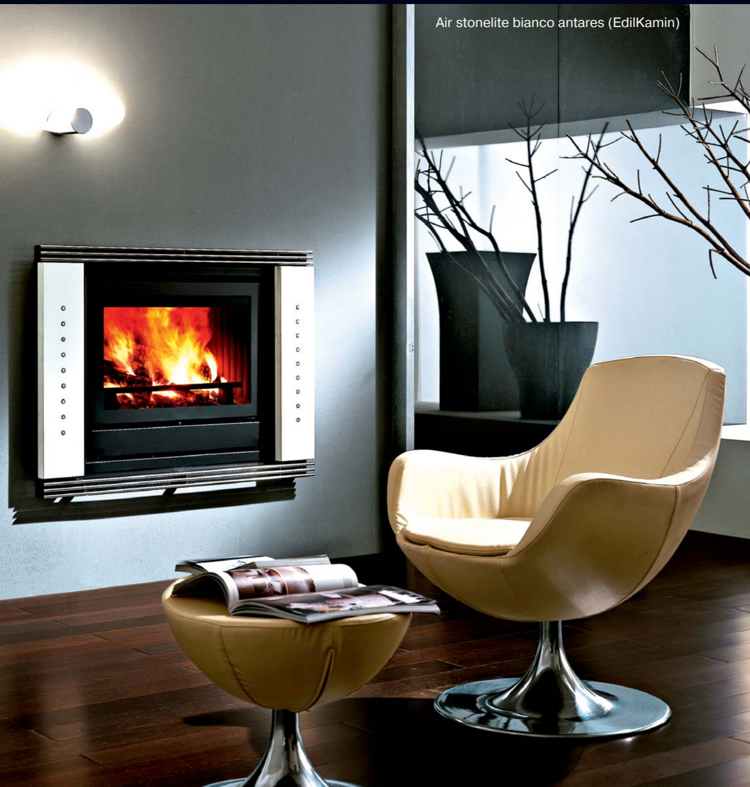
Air stonelite bianco antares (EdilKamin)

В новом салоне компании представлено более сотни каминов, печей, мраморных порталов и других редких экземпляров, по своему дизайну сравнимых с подлинными произведениями искусства. Среди всего этого многообразия следует особо выделить продукцию таких известных европейских брендов как Don-Bar (Бельгия), Fugar (Испания), Supra (Франция), Richard le Droff (Франция), EdilKamin (Ита-